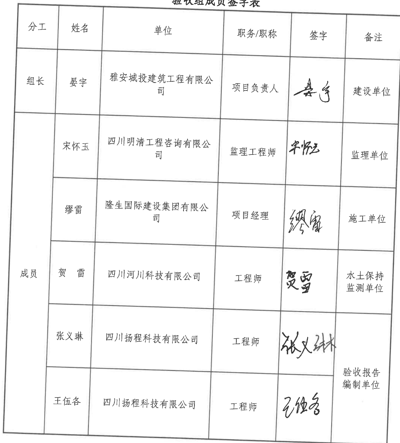
验收组成员签字表